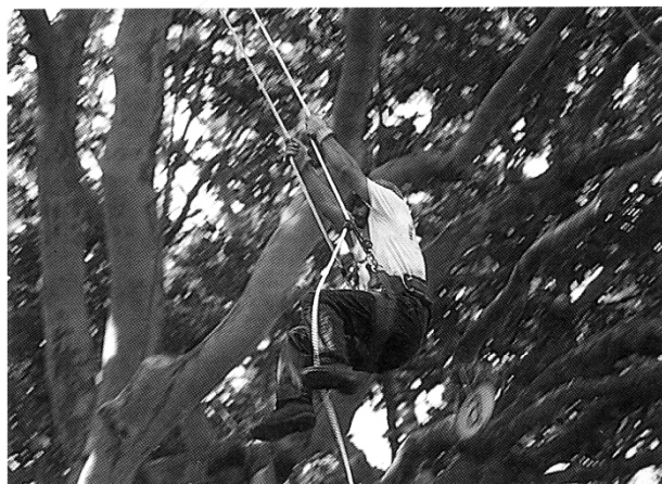
Oben: Von Baum zu Baum

Rechts: Die verletzte Person wird mit zwei Karabinern gesichert und zu Boden gelassen