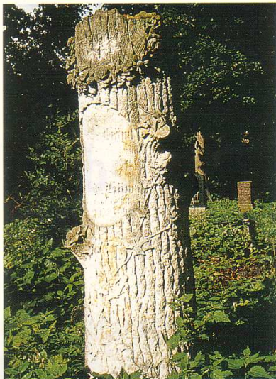
Nicht nur wegen der Bäume lohnt der Besuch auf dem Friedhof. Alte, verspielte Grabsteine überraschen durch Form und Gestalt.