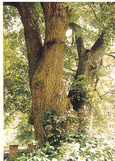
Von dieser kolossalen Gabelung haben sich schon die damaligen Dorfbewohner beeindrucken lassen. Sie sicherten die dicken Stämmlinge mittels eines Eisenrings gegen Bruch ab.

beiblättern wurde zum Beispiel Zahnpulver hergestellt. Aber auch Schießpulver wurde aus Lindenholzkohle produziert. Wertvolle Seile, Schnüre und Textilien fertigten unsere Vorfahren aus dem Bast des Holzes an. Dazu legten sie meterlange Holzstämmchen ins Wasser, bis sich die dünnen Bastbänder ablösten. Nach dem Trocknen konnte der Bast weiterverarbeitet werden. Die Römer schätzten den Honig der Blüten, zu damaliger Zeit der einzige Süßstoff und daher sehr kostbar. Die Lindenblüte erlebt zur Zeit eine Renaissance. In unserer aussortierten und weggespritzten Landschaft sind blühende Pflanzen schon fast eine Seltenheit. Die Insekten sind gezwungen, sich auf die Linden zu konzentrieren, und finden dort nicht genügend Nahrung (Hummelsterben unter Silberlinden). Der Lindenblüten-Tee ist bekannt für seine „lindernde“ Wirkung bei Erkältungen.