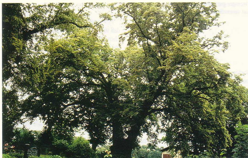
Die Linde mit ihrem gesamten Habitus: Über 16 m Höhe und 22 m Breite mißt der gewaltige Baum. Zwischen 400 und 600 Jahre schätzt man im Dorf das Naturdenkmal.

unter und auf den Bäumen. Bis vor kurzem waren die Linden Richtsaal und Richtstätten in einem. Zu nutzen wußten die Menschen die „Stoffe“, aus dem die Linde besteht, schon immer. Aus gemahlener Lindenholzkohle und gemahlener Sal-